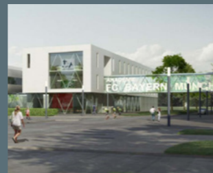
Campus FC Bayern München