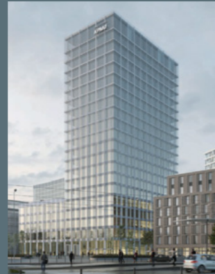
Hochhaus am Europaplatz Berlin