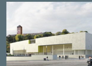
Sport- und Freizeitbad Potsdam